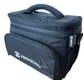
Brašna HM-SP01-POUCH HM.314200180