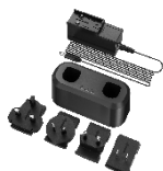
Nabíjecí spanice HM-5202ZC2 HM.314200036